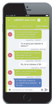
MESSAGERIE DU CABINET